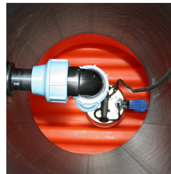
Easy pumpbrunn set från ovan