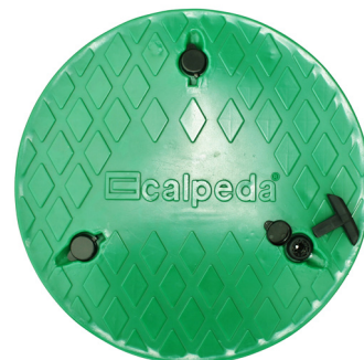
GEO 550 lufttäta låsbara locket.