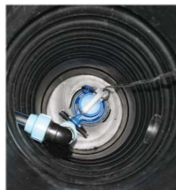
Näpsä 500- pumppaamo sisältä ylhäältä katsottuna