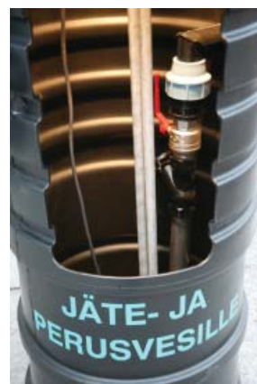
Näpsä 600- pumppaamo sisältä