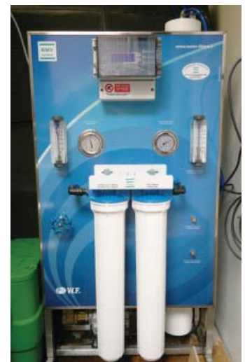
RO-K -suolanpoistojärjestelmä asennettuna vapaa-ajan asunnon tekniseen tilaan.

RO-K -tuoteperheessä löytyvät myös suuremmat mallit RO-K 400, RO-K 650 ja RO-K 900 - kysy lisää!