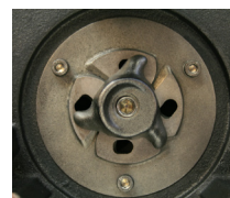
Skärhuvudet i höghållfast rostfritt stål

Dreno Grix-32-2 / 090 är en robust i gjutjärn tillverkad pump för avloppsvatten. Den robusta i gjutjärn tillverkade pumphuset i kombination med den kraftiga motorn garanterar att pumpen fungerar långa tider problemfritt.