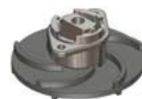
Repijä ruostumattomasta teräksestä

Dreno Grix -pumput ovat Euroopassa valmistettuja. Tässä eurooppalaisessa laatutuotteessa yhdistyy edullinen hankintakustannus ja korkean laadun tuoma pieni elinkaarikustannus.