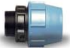
SUORA LIITIN/PL/UK 1003