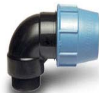
KULMALIITIN PL/UK 1008