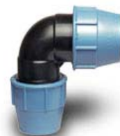
KULMALIITIN PL/PL 1006