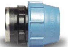
SUORA LIITIN/PL/SK 1004