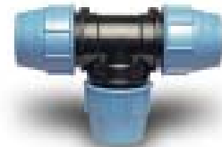
T-LIITIN PL/PL/PL 1005